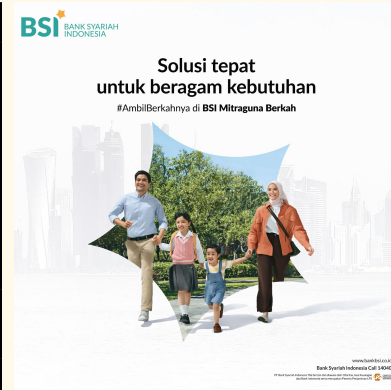
Slide Akhir Link Download